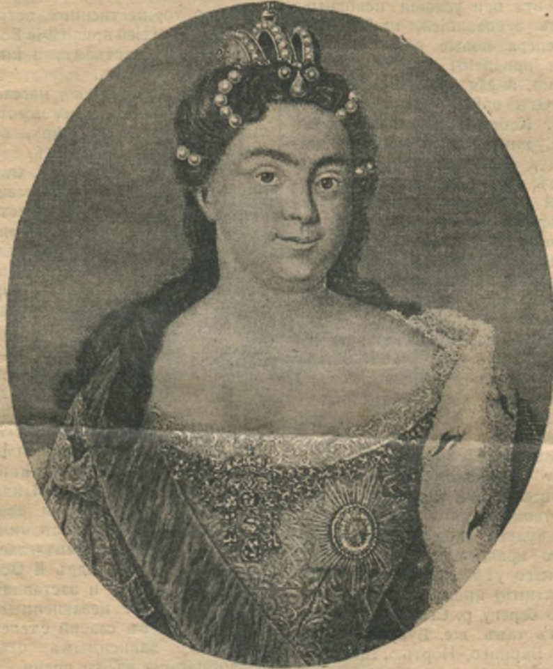
ИМПЕРАТРИЦА ЕКАТЕРИНА I.